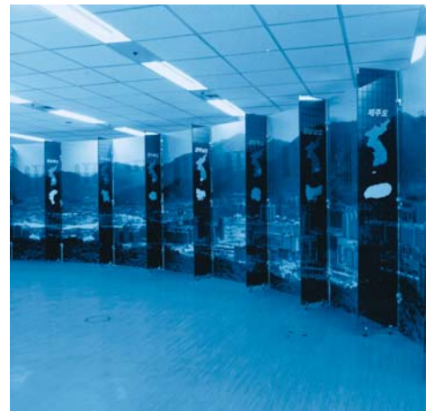
006 Korea Detail Dup.jpg