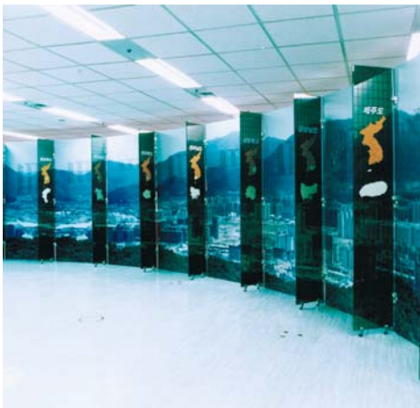
006 Korea detail.jpg