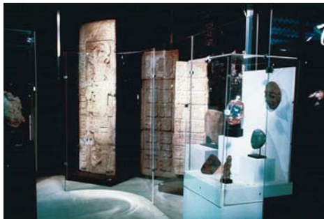
041 Societ_ G_nerale small.jpg