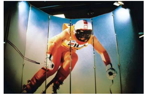
037 Tyrolia small.jpg