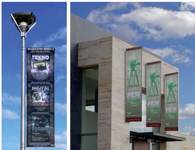
flag not included