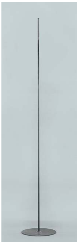
art. nr LB1200195GR stativ tillverkat i svart pulverlackerad metall, höjd 1200 mm, fot Ø 195 mm