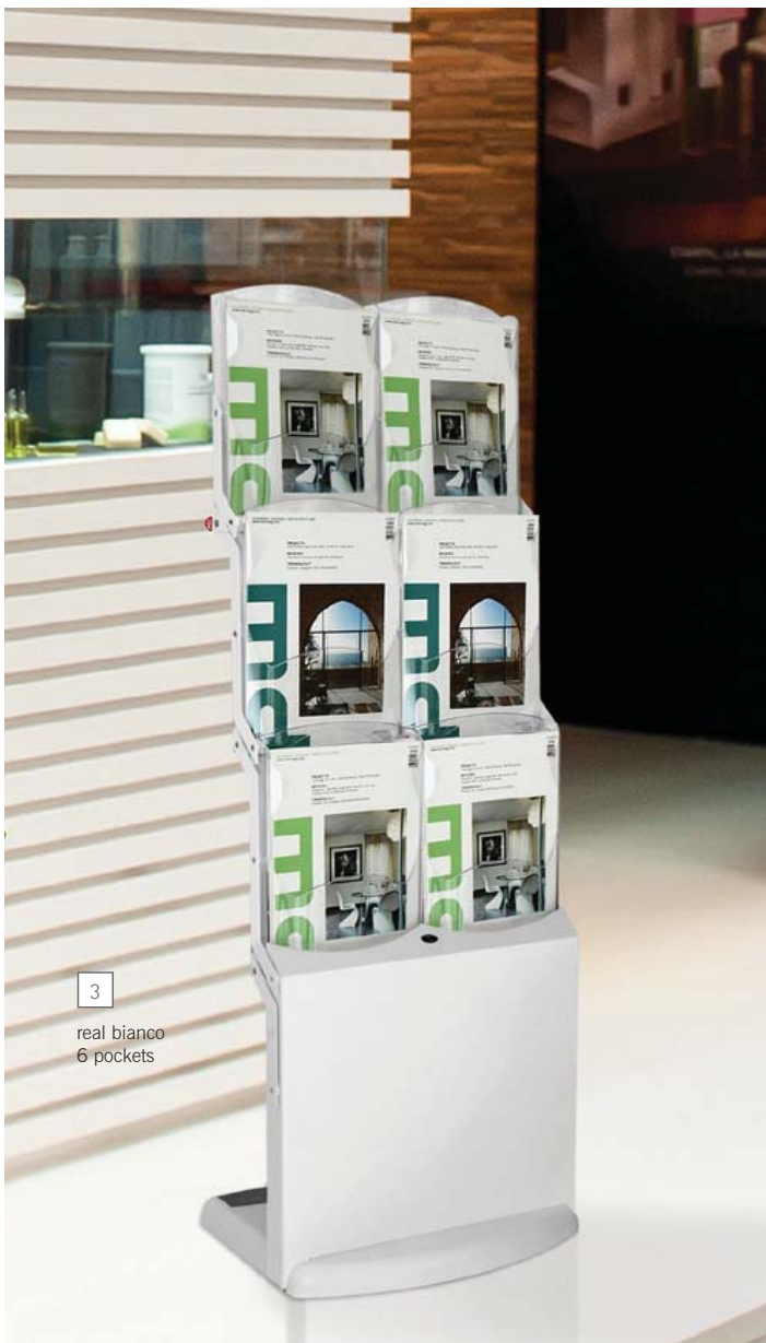
3 real bianco 6 pockets