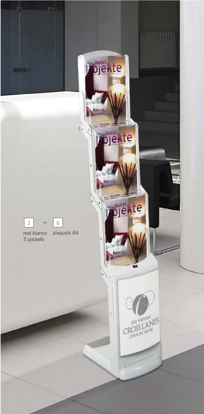
2 + 6 real bianco 3 pockets pixquick A4