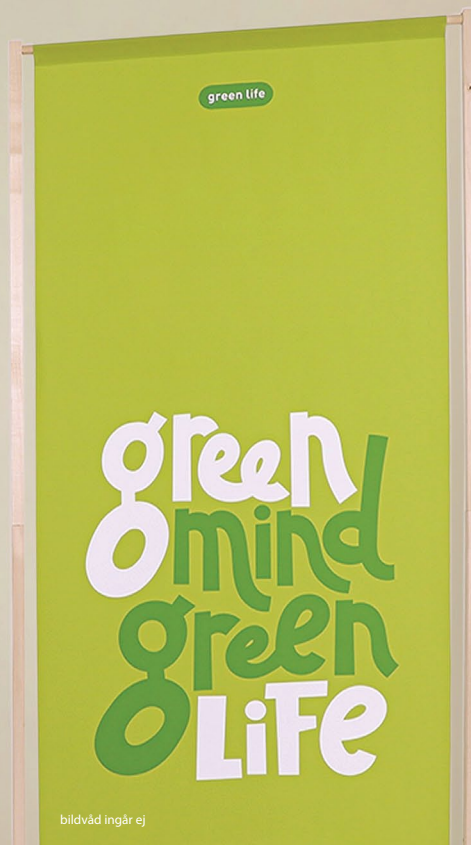
bildvåd ingår ej